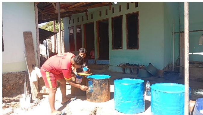
Gambar 4.1. Pembuatan Tempat Sampah Dari Drum Ter

Penanganan masalah sampah yang dilakukan secara cepat sebagai bentuk kontribusi mahasiswa KKN Angkatan XVIII Tahun 2025 dari Universitas Nusa Lontar Rote lintas disiplin ilmu adalah pembuatan tempat sampah umum di setiap lingkungan pemukiman dan juga didepan Kantor Camat Rote Tengah, Kantor kelurahan Onatali, Kantor Desa Persiapan Daifadin dan sepanjang jalan umum Provinsi di wilayah Kecamatan Rote Tengah. Di setiap titik dibangun satu tempat sampah dari bahan drum ter dengan tujuan agar masyarakat dapat membuang sampah pada tempat yang telah disediakan sehingga menghindari sampah yang bertumpukan dan berserakan. Apa yang dilakukan mahasiswa baru sebatas mengatasi sampah lingkungan yang selama ini dibuang tidak pada tempatnya tetapi belum mengarah kepada bagaimana harus mengolah sampah tersebut menjadi produk lain yang memiliki nilai tambah secara ekonomi sekaligus mengurangi dampak lingkungan yang merugikan masyarakat.