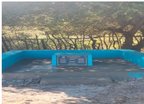
Gambar 4.2.Tempat Duduk Pojok Baca

Salah satu penyebab masyarakat membuang sampah tidak pada tempatnya adalah karena kurangnya literasi sejak dini bagi peserta didik. Tidak ada referensi bacaan ataupun video yang bisa dijadikan bahan belajar bagi masyarakat tentang pengelolaan sampah. Untuk itu atas inisiatif mahasiswa KKN Angkatan XVIII tahun 2025 dari Universitas Nusa Lontar Rote maka telah dibangun pojok baca desa yang bertujuan untuk bisa dijadikan sebagai tempat bagi pelajar maupun masyarakat untuk membaca atau belajar dengan tenang terutama membaca atau menonton video yang dapat membentuk pengetahuan, kesadaran dan keterampilan mengolah sampah menjadi produk lain yang bernilai ekonomi sehingga bisa mengatasi masalah sampah lingkungan yang saat ini sedang dialami masyarakat.